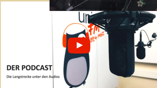
DER PODCAST Die Langstrecke unter den Audios