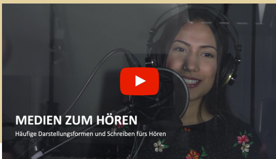
MEDIEN ZUM HÖREN Häufige Darstellungsformen und Schreiben fürs Hören

YOUTUBE PLAYLIST: CROSSMEDIALE MEDIENPRODUKTION | ADA RHODE