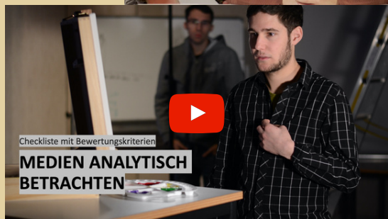
Checkliste mit Bewertungskriterien MEDIEN ANALYTISCH BETRACHTEN