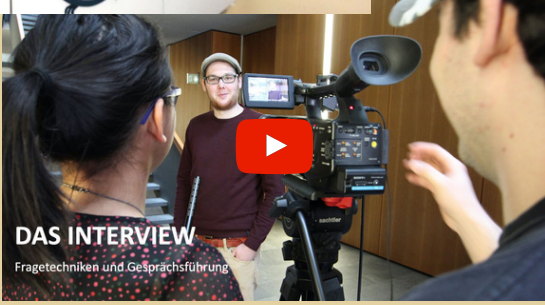
DAS INTERVIEW Fragetechniken und Gesprächsführung