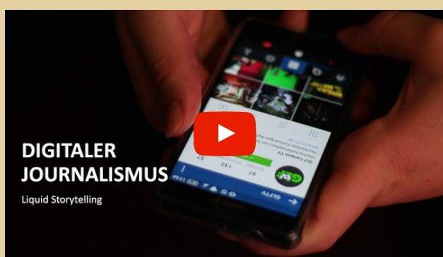
DIGITALER JOURNALISMUS Liquid Storytelling